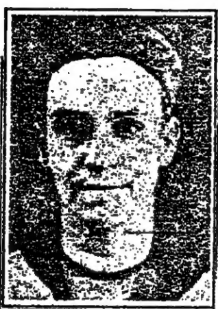
ابو القاسم الشابي